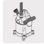
Almacenamiento de accesorios incorporado