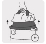
Asa de liberación rápida que facilita el vaciado