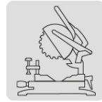
Para sierra de inglete