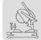
Para sierra de inglete