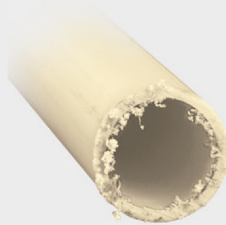
Corte con segueta