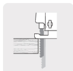
Longitud de carrera