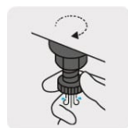
Válvula de drenado