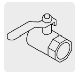
Salida para manguera de 3/4"