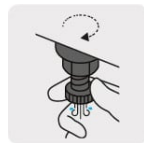
Válvula de drenado