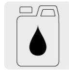
Incluye un bote de 250 ml de aceite monogrado SAE30