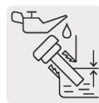
Sensor de nivel bajo aceite