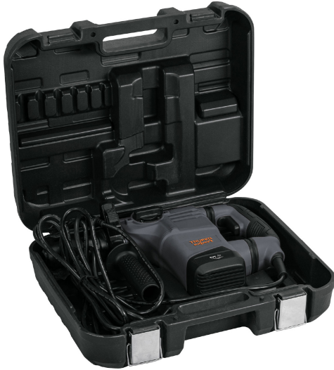
Incluye estuche plástico