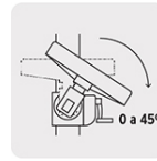
Mesa inclinable de 0 a 45°