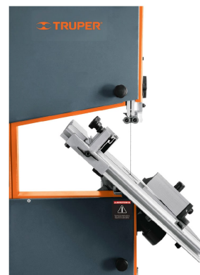
Inclinación de mesa 45°