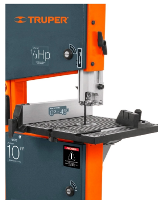
Guía de inglete