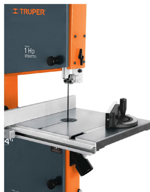
Guía de inglete