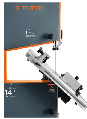
Inclinación de mesa 45°