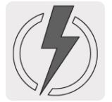
Protección de sobrecarga