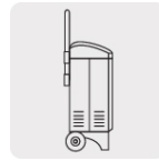
Fácil almacenamiento y transporte