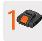
Incluye batería ion litio