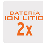
Más tiempo de vida Mayor velocidad de carga