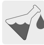
Resistente a ácidos