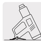
Soporte para trabajar a manos libres