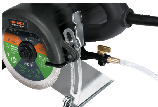
Sistema de lubricación de corte