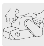
Operación a dos manos