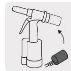
Recolector de vástagos